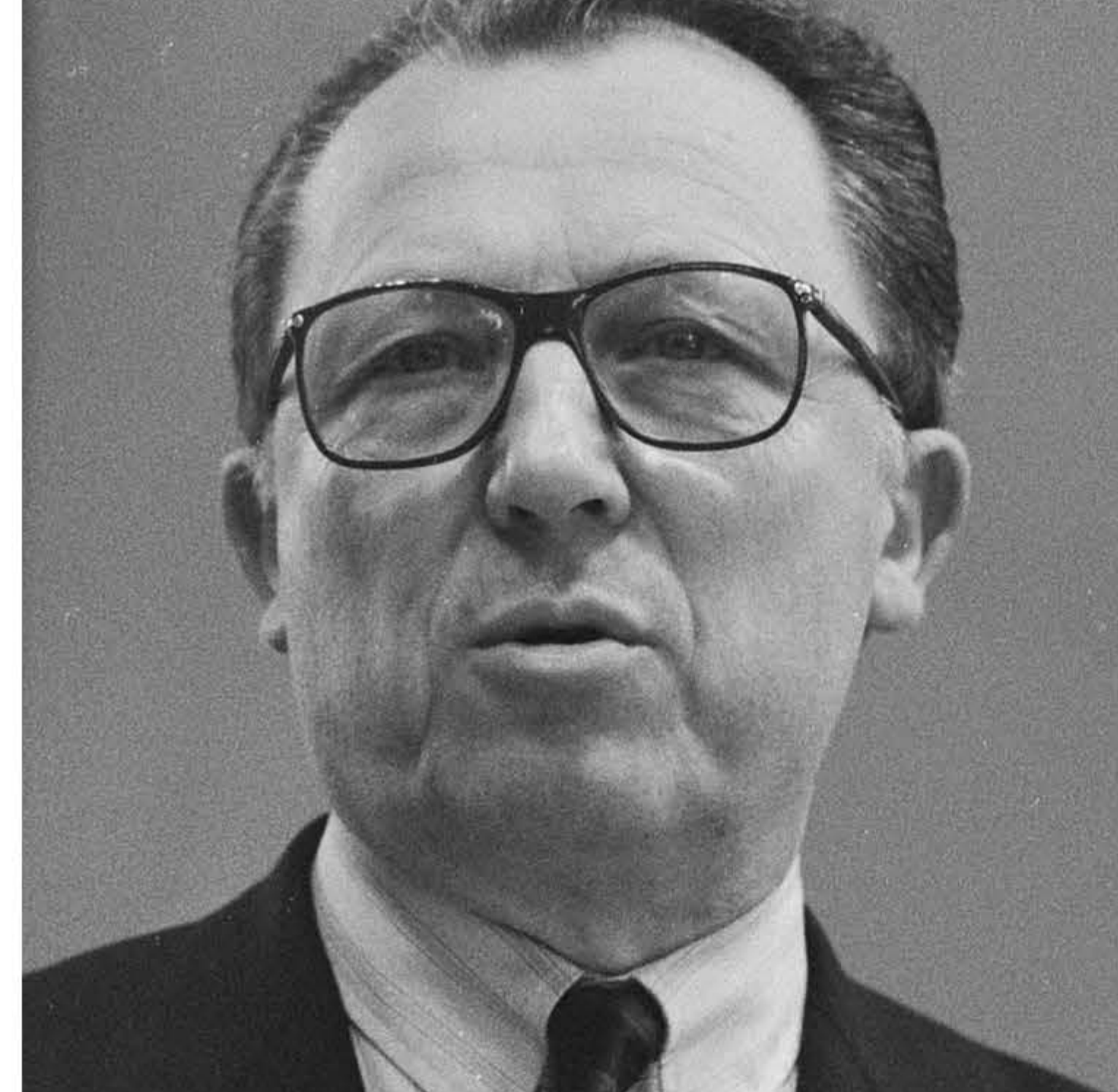
İhan Selçuk'un Yazıları

21 Haziran 2010 tarihinde yitirdiğimiz Cumhuriyet Gazetesi Bayyazarı İhan Selçuk'un yazılarından seçmeler okullarımızla buluşturuyoruz. Bu köşede yitirdiğimiz bilgisi Selçuk'un günümüzde eşik tutan yazılarını bulabileceksiniz.