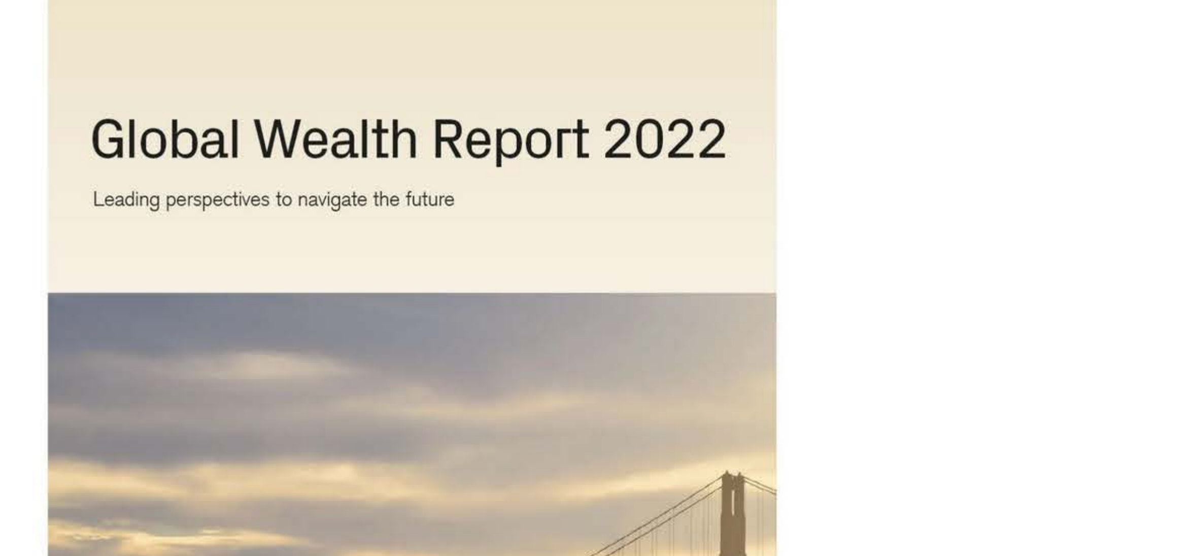
Credit Suisse'in 2022 Dünya Servet Raporu

The Economist'in 26 Şubat tarihli "Özel Piyasalar" (Private Markets) raporu açık seçik yazmıştı: "Geçmiş on yıl, özel finans piyasaları için bir altın dönem oldu!" Yani, "rantıye"nin bayram ettiği bir on yıllık bağını getiriyoruz. 2008'de Fed, anlayana anlamayana "Yangında kur tarılacak tek şey finans sermayesidir!" diyerek başlattığı politikasını aksatmadan, tutarlılıkla sürdürdüktan sonra finans sermayesinin ve böylece "rantıye"nin "en yüce değer" olduğu yere varıyoruz. Burada, geldiğimiz yerde bilenlerin bilmeyenlere anlatması gereken bir "ilahî gerçek" var: Kapitalizmde ekonominin üretim sahnesi ile "piyasalar" diye konuşulduğu zaman söz konusu sahne ayrı (ve son 30 yılda kavranmış olmalı ki unuyorsun) âlemlerdir. Bir yaratım danışmanının 14 Ekim tarihli sitesi apaçık sunuyor: Davın Raporu. Diyor ki: "Enflasyon ekonomiyi perişan ediyor ama piyasalar yükselişe geçiyor!" "Üretim dünyası başka, rantıyelerin dünyası başkadır" diyor kısaca. (Bunu 250 yıl kadar önce, rantıyelerin herhangi bir "değer" yaratmadığını üstüne basarak, kimilerin bugün "piyasa tanrısı" saydığı Adam Smith de söylememiş miydi?)