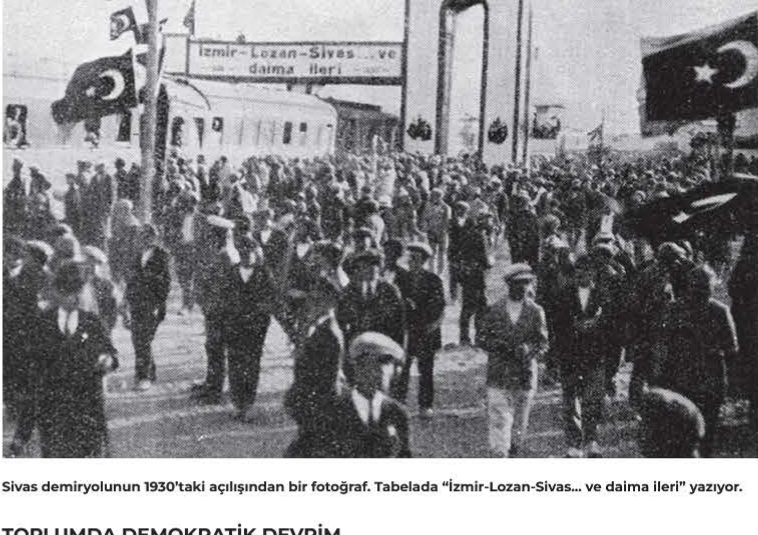
Sivas demiryolunun 1930'taki açılışından bir fotoğraf. Tabelada "İzmir-Lozan-Sivas... ve daima ileri" yazıyor.

Söndü. Çünkü o güç bloku köylülük üzerindeki "mutlak vesayet"inin ağırlığını koydu. Vesayetin aslı sınıfsaldır. 1940'ların hamlesi ve sonucu bunu belgeleyen örnektir. Bu bir. İkincisi, ileri hareketi durduran "blok" artık karşıdevrimin tohumlarını taşıyor. İstemeksizin mi? Hayır. Çünkü hedefi bellemiştir: Cumhuriyet'i eriştiği noktada dondurmamak, ileri hareketini kesmek. Şunu görmeliyiz: İleri hareketin "demokratik devrim" taşıdığını, bunun ne demek olacağını karşıdevrimciler Cumhuriyetçilerin çoğunluğuna göre daha iyi kavramışlardır. Bu kavrayış farkı o günden bugüne kapanmamış görünüyor!